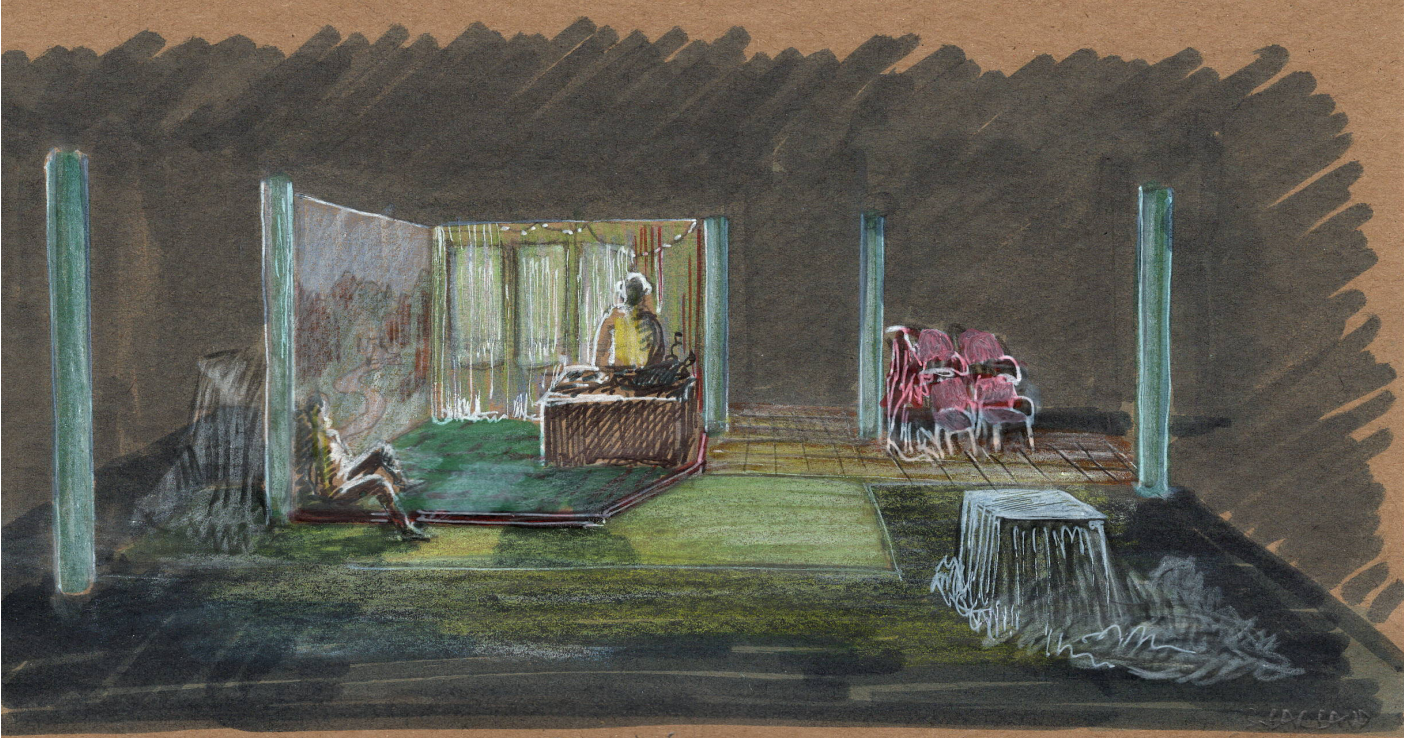
MANGER LES CHEVAUX - LE PMU VIDÉ -